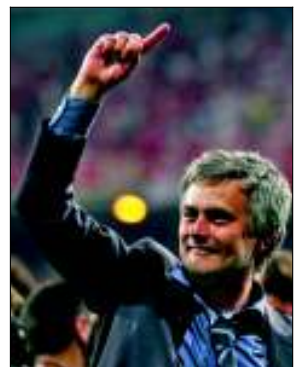
José Mourinho jubled over lørdagens triumf i Champions League-finalen, hvor Inter vandt 2-0 over Bayern München.

Real Madrids nuværende træner Manuel Pellegrini er dog formelt stadig chef, men ifølge flere medier er det blot et spørgsmål om tid, hvornår fyringen kommer. /ritzau/